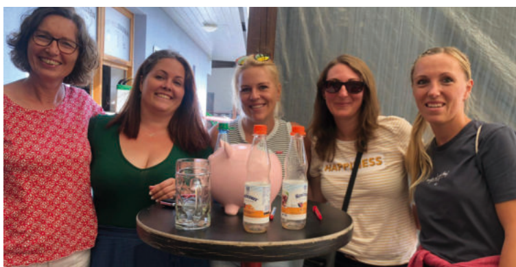
Das Helferteam vom Kinderfest