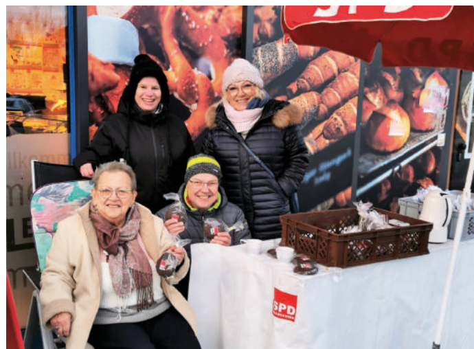
Weihnachtliche Lebkuchenverteilung bei Edeka Legat