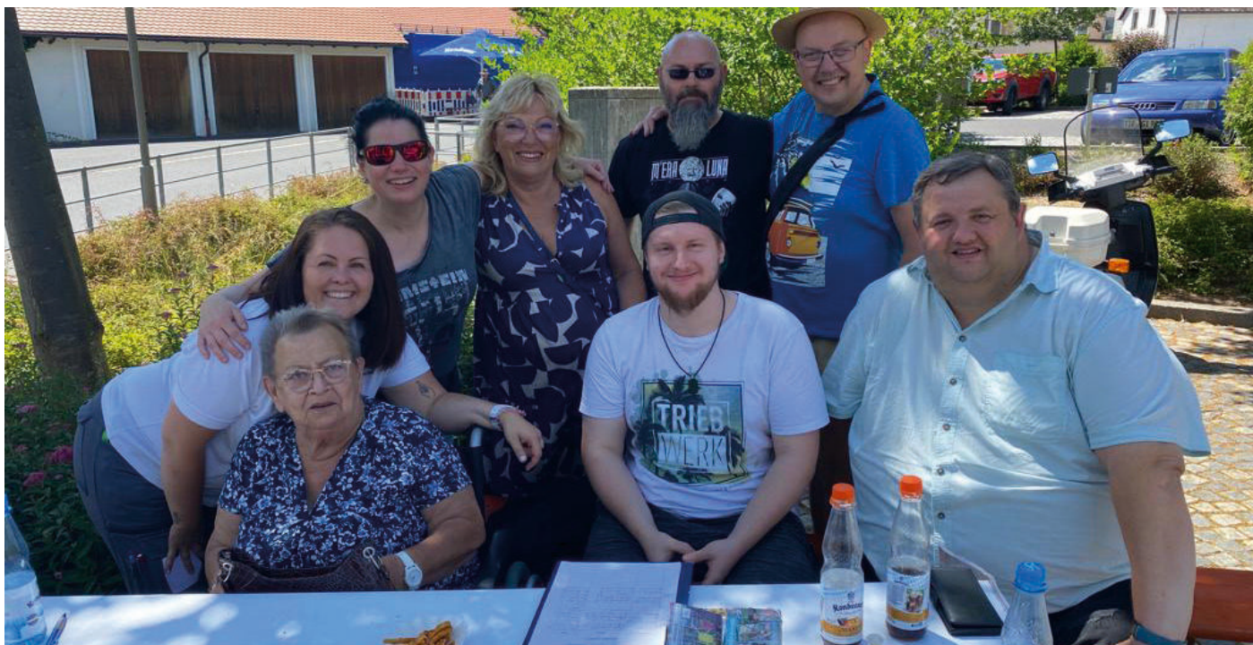
Kreidemalwettbewerb beim Bürgerfest 2022