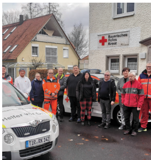
Silvesterbesuch der Stadtratsfraktion beim Roten Kreuz