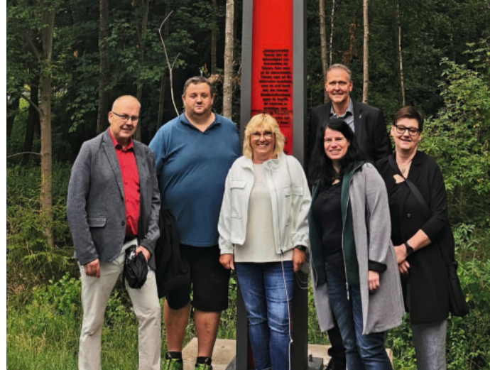
Einweihung der Friedenssäule am Grenzübergang Svatý Kriz