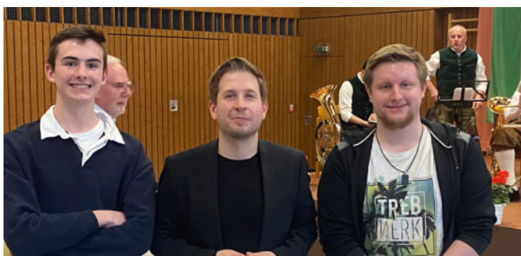
Besuch des SPD-Generalsekretärs Kevin Kühnert beim 125. Jubiläum der SPD Fuchsmühl